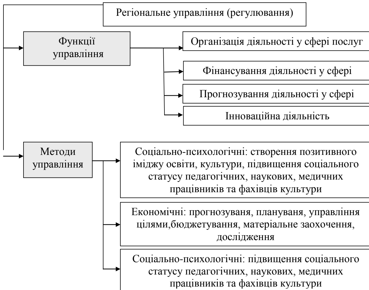
Рис. 3. Функції та методи регіонального управління

Також функції регіонального управління можна поділити на чотири групи (рис. 3). Функції управління здійснюються та реалізуються за допомогою методів управління [4, с. 87].