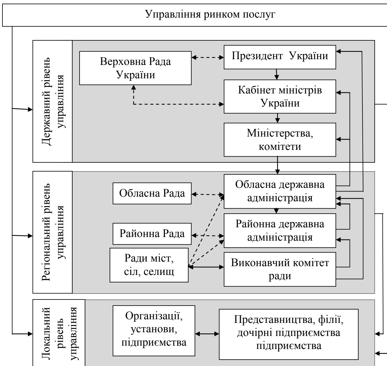
Рис. 1. Система управління ринку послуг в Україні