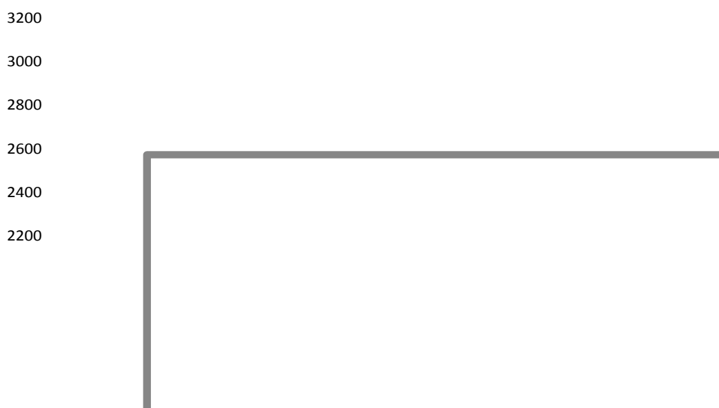
Рис. 3. Динаміка зміни середньої зарплати в Україні в 2011, в гривнях

Існуючий рівень заробітної плати не стимулює підвищення продуктивності праці, яка в 2011 році становила лише 30% від показника країн Європейського Союзу. За даними Держкомстату України середня зарплата в грудні 2011 склала 3054 гривні (рис. 3). У січні 2011 року середня зарплата по країні дорівнювала 2297 гривень.