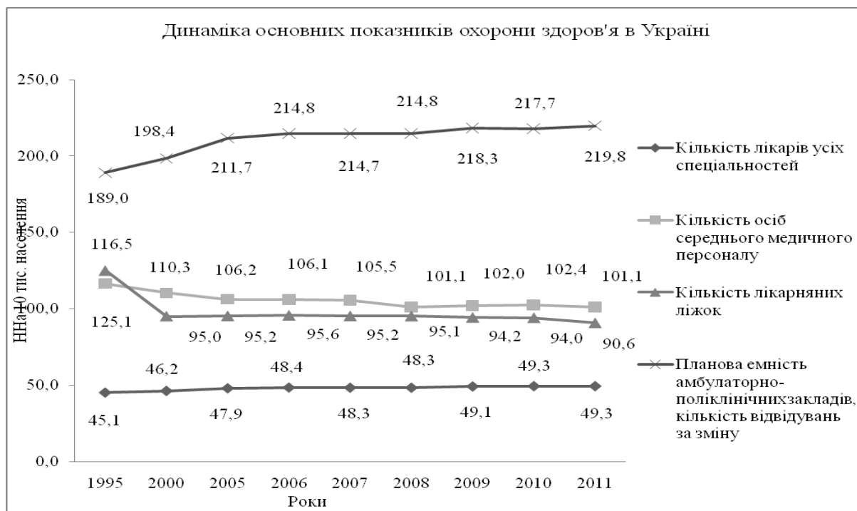
Рис. 1. Динаміка основних показників охорони здоров'я в Україні в 2011 р.

Станом на 2011 рік в Україні не вистачає 46,9 тис. лікарів, з них понад 12% (6 тис.) у сільській місцевості. Дещо стримує критичну ситуацію наявність працюючих лікарів-пенсіонерів. У системі охорони здоров'я України працює понад 111 тис. медичних працівників пенсійного віку (43% лікарів, 61,2% медичних сестер). При цьому, якщо питома вага осіб пенсійного віку серед лікарів у 1998 р. становила 18,5%, то на початок 2011 р. – 24,5%. Та близько 15% лікарів – особи передпенсійного віку. Особливо гостро постає ця проблема на первинній ланці обслуговування. Найбільший відсоток «постаріння» кадрів зафіксований у таких регіонах як: Дніпропетровська (28,6%), Кіровоградська (27,9%), Черкаська (29,3%), Чернігівська (28,6%) області та АР Крим (30,5%). Особливе занепокоєння у питанні кадрового забезпечення викликає Миколаївська, Херсонська та Кіровоградська області, де досить високий відсоток лікарів пенсійного віку спостерігається поряд з найнижчою забезпеченістю лікарями.