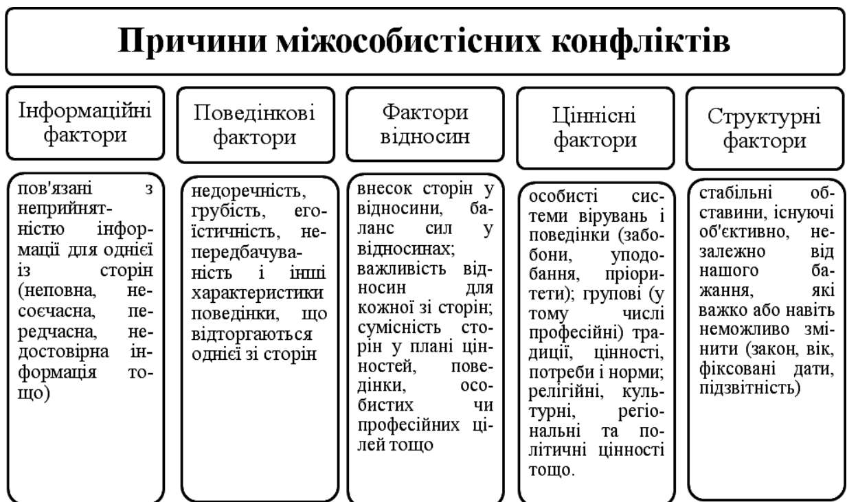
Рис. 1.2. Чинники міжособистісних конфліктів

При аналізі міжособистісного конфлікту корисно виділити причинні фактори, які дозволять більш повно визначити зону розбіжностей і намітити шляхи вирішення. Існує п'ять груп таких факторів (рис. 1.2).