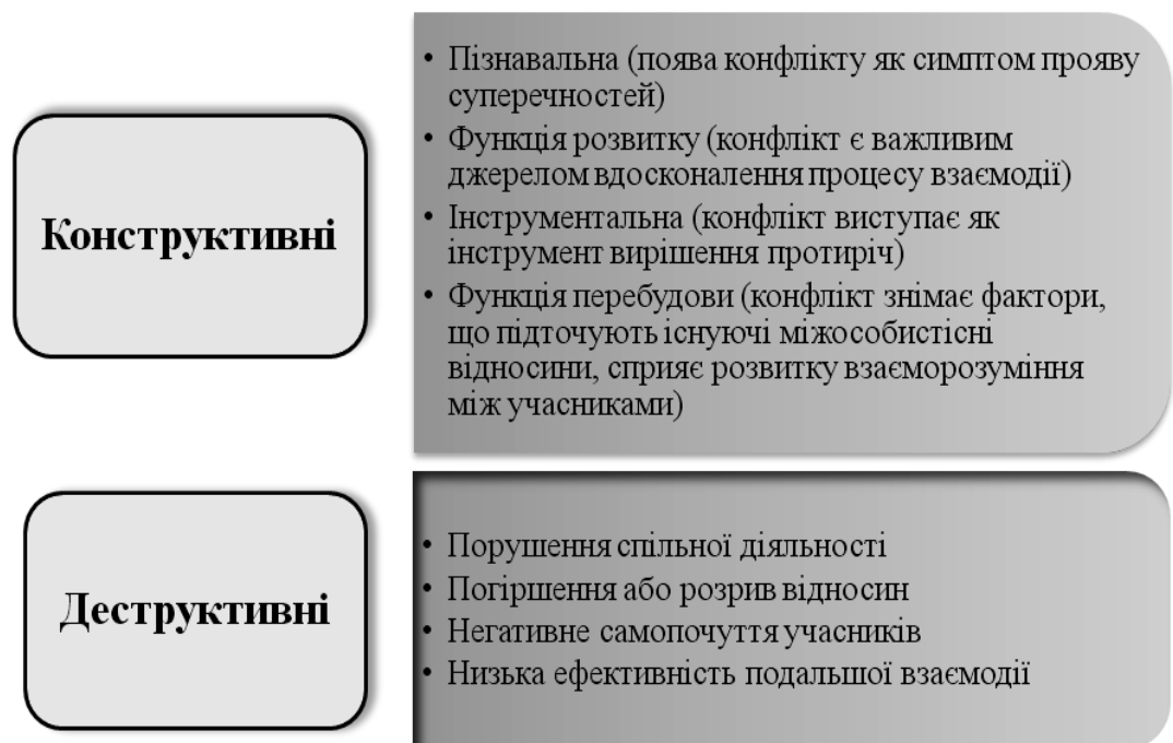
Рис. 1.1. Функції міжособистісного конфлікту

Міжособистісний конфлікт виконує як негативні так і позитивні функції. На основі узагальнення літературних джерел [5; 31] укладено схему (рис. 1.1).