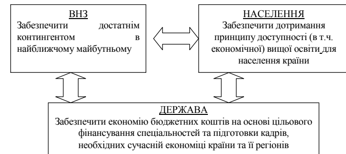
Рис. 1. Узгодженість інтересів суб’єктів ринку освітніх послуг на основі чинника рівня фінансування освіти

Що потрібно змінити в системі фінансування вищої освіти, для того щоб: