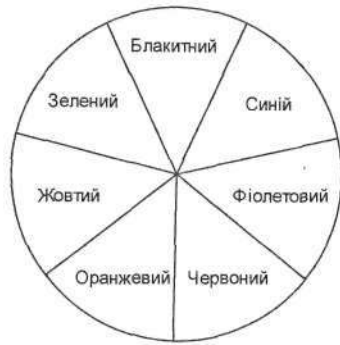
Рис. Колірний ряд Ньютон

Спектральний колірний ряд , який ще іноді називають “ райдужним кругом ”, “ хроматичним кругом ” або “ спектральним кругом ”, використовується передусім в оптиці. Традиція розміщення спектральних кольорів не смужкою, як це зробив Ньютон, а кругом, побутує з 1735 року. Хроматичний круг класифікує кольори світлових потоків із фізичного аспекту – за довжиною електромагнітних хвиль.