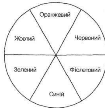
Рис. Колірний ряд Гете

У дизайні, крім нього, широке застосування має й інший колірний ряд, запропонований німецьким мислителем XVIII – початку XIX століття Іоганном Вольфгангом Гете. Це колористичний круг . У ньому основними кольорами є червона, жовта і синя барви, а неосновними – оранжева, зелена та фіолетова. Неосновні кольори виникають через механічне змішування двох основних, між якими вони знаходяться: зелений – жовтої і синьої, фіолетовий – синьої та червоної, оранжевий – жовтої і червоної фарби.