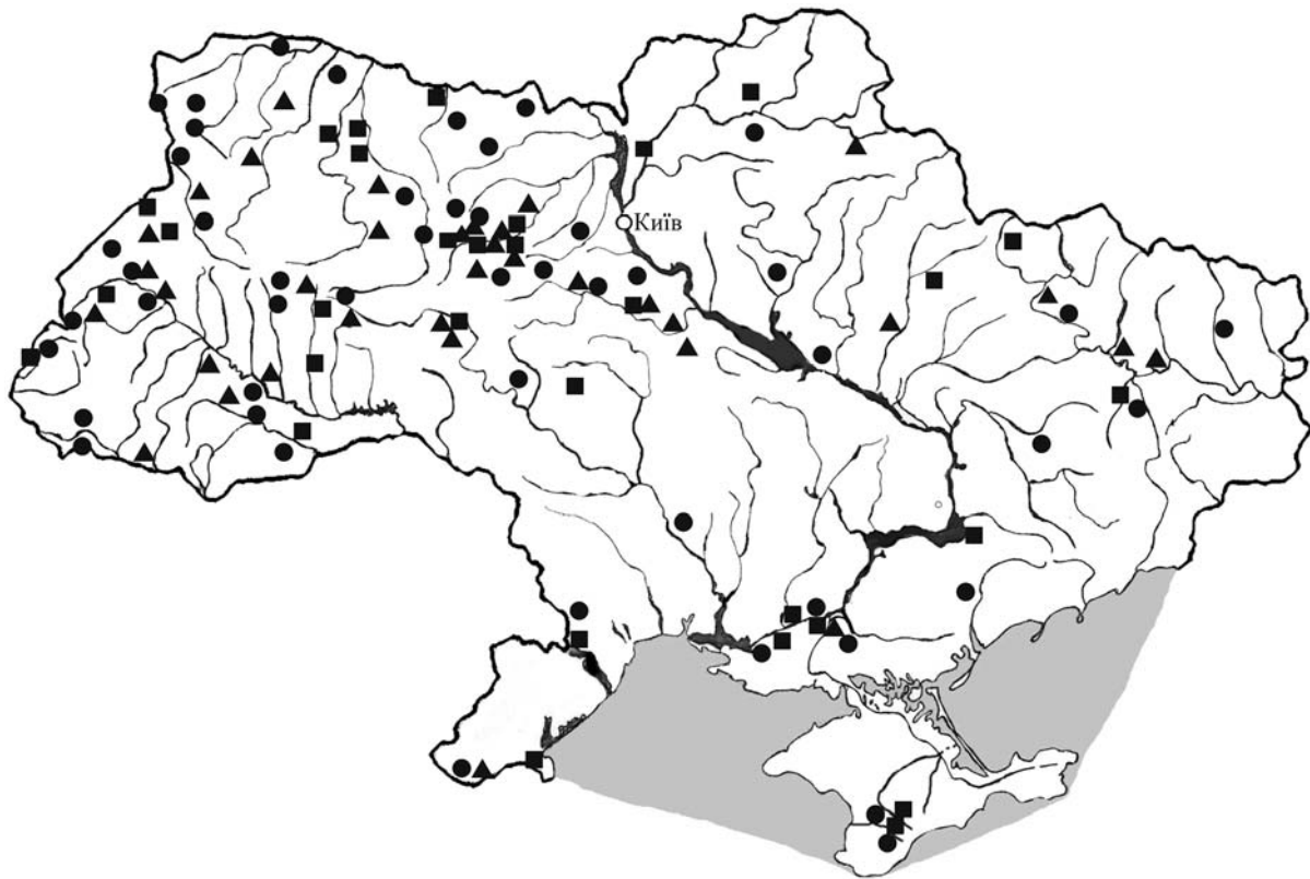
Рис. 2. Места сбора Gyraulus acronicus (кружки); Gyraulus laevis (квадраты); Gyraulus rossmaessleri (треугольники). Данные авторов.