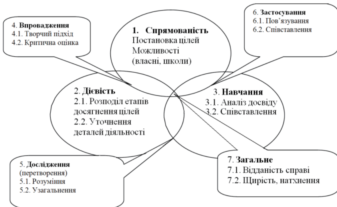
Рис.2. Модель розвитку педагогічних навичок

Об'єднавши розглянуті вище навички, отримуємо модель їх розвитку (рис. 3.). Центральна частина моделі (перетин трьох кругів) містить якості, без яких неможлива цілісна, гармонійна особистість педагога. Відданість справі сприяє досягненню поставленої педагогом мети – вирішення конфлікту; щирість, натхнення свідчать про любов педагога до своєї справи, без наявності якої будь-які навички недоцільні [3].