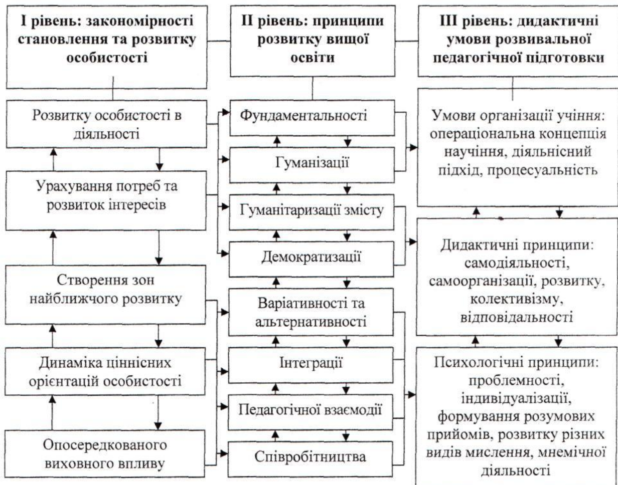
Рис. 2. Система педагогічних умов формування професійної готовності до реалізації розвивальної функції навчання.

Перша закономірність (розвитку особистості в діяльності) полягає в тому, що формування соціально-психологічних новоутворень у студентів проходить у процесі повноцінної діяльності як особливої форми їхньої активності. Рівень розвитку цієї діяльності визначає рівень особистісного розвитку. Ми апелюємо до думки українського психолога В. Рибалка, згідно з якою особистість - це суб'єкт свідомої продуктивної діяльності та суспільної поведінки, індивід із соціально зумовленою системою психічних властивостей, що формується і виявляється у творчій та самоперетворюючій діяльності, спілкуванні та опосередковує, регулює взаємодію людини з навколишнім світом [7].