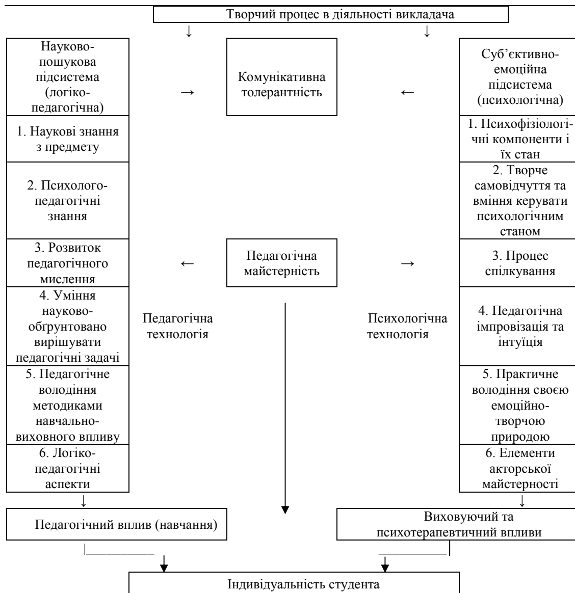
Рис. 1. Місце комунікативної толерантності у психологічній моделі творчої діяльності викладачів

Поняття комунікативної толерантності – одна з важливих категорій теорії ненасильства в освіті. Вона складає основу педагогічного спілкування викладача й студента, сутність якої зводиться до таких принципів навчання, які створюють оптимальні умови для формування культури гідності, самовираження того, хто навчається, виключають страх перед неправильною відповіддю, призводять до активної діяльності на лекціях та семінарах.