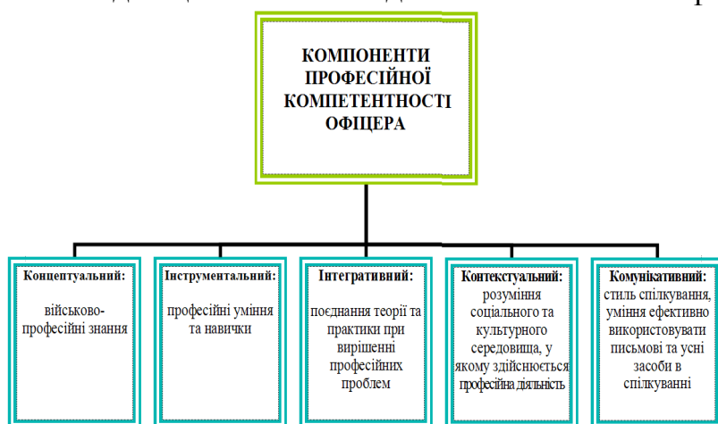
Рис. 1. Структура професійної компетентності офіцера радіоінженерної спеціальності

Загальні соціальні вимоги до формування світоглядних, культурних та інших якостей фахівця, до розвитку в нього загальних і спеціальних здібностей відображають гуманістичну спрямованість змісту освіти, головною метою якої є підвищення якості підготовки військових фахівців.