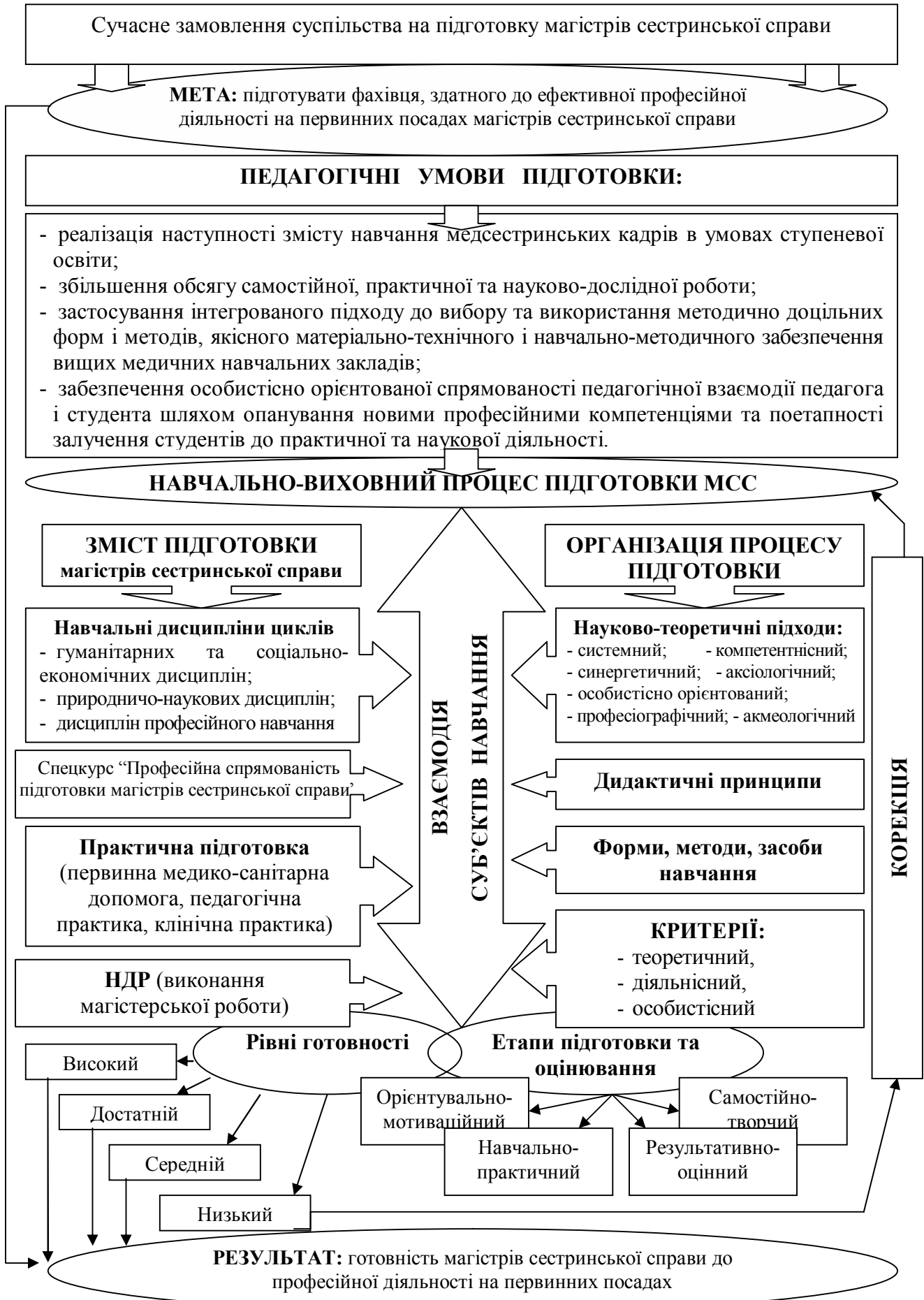
Рис. 1. Модель професійної підготовки магістрів сестринської справи