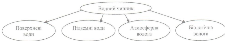
Рис. 1. Складові частини водного чинника

Виклад основного матеріалу й обґрунтування отриманих результатів дослідження. На формування сучасного ландшафтного різноманіття басейну р. Стиру впливає чимало чинників: геологічна будова, рельєф, клімат, поверхневі води, ґрунти, рослинний та тваринний світ, людина. Вважаємо, що актуальним є вивчення водного чинника, який у широкому розумінні є таким, що охоплює поверхневі та підземні води, атмосферну вологу, а також воду живих організмів (рис. 1).