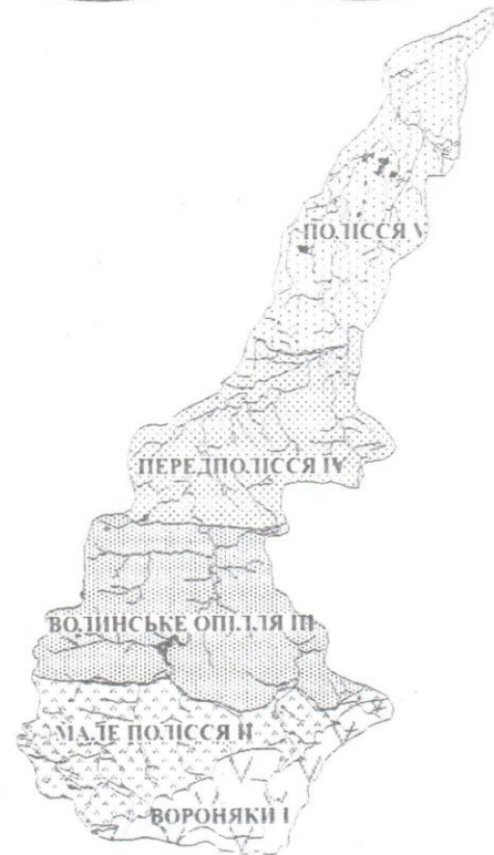
Рис. 2. Модальні ділянки в басейні р. Стиру

Попередні дослідження показали, що басейн р. Стиру має значні відмінності природних умов [1; 2]. Субмеридіональна протяжність басейну з півдня на північ, геоморфологічні і зональні географічні відмінності зумовили виділення в його межах п'яти модальних ділянок: 1 – Вороняки, 2 – Мале Полісся (верхів'я річки), 3 – Волинське Опілля, 4 – Передполісся (середня течія) та 5 – Полісся (понижся річки), що характеризуються не лише відмінностями у прояві гідрохімічних процесів, а й різняться за структурою земельних угідь (рис. 2, 3).