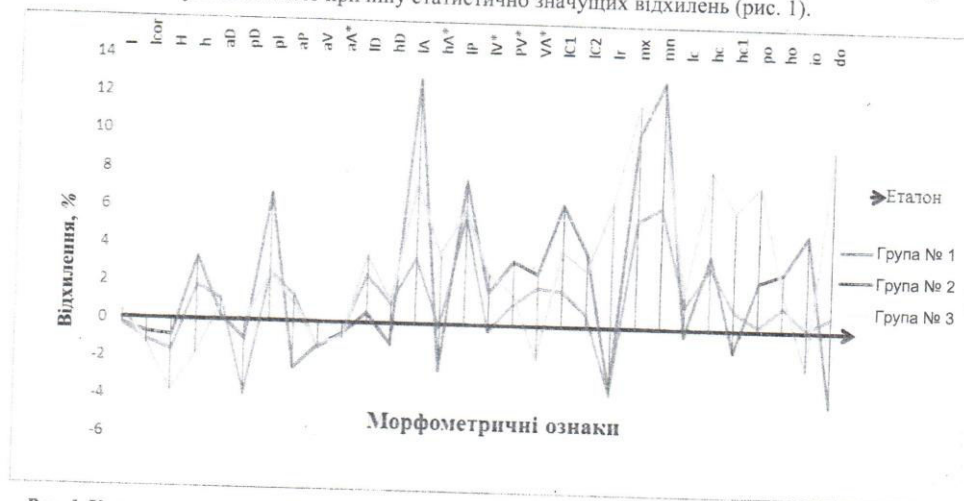
Рис. 1. Коливання значення відхилення показників пластичних ознак кольорових порід коропа кої

За результатами встановлених значень відхилень показників пластичних ознак і за характеристикою їх змін установлюємо причину статистично значущих відхилень (рис. 1).