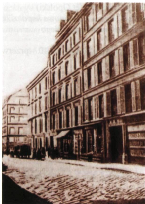
Dom przy rue Ponthieu 34 w Paryżu, ostatnie miejsce zamieszkania J. Słowackiego