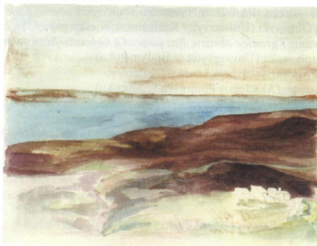
Pagórkowaty brzeg morza. Akwarela J. Słowackiego w Albumie podróży na Wschód