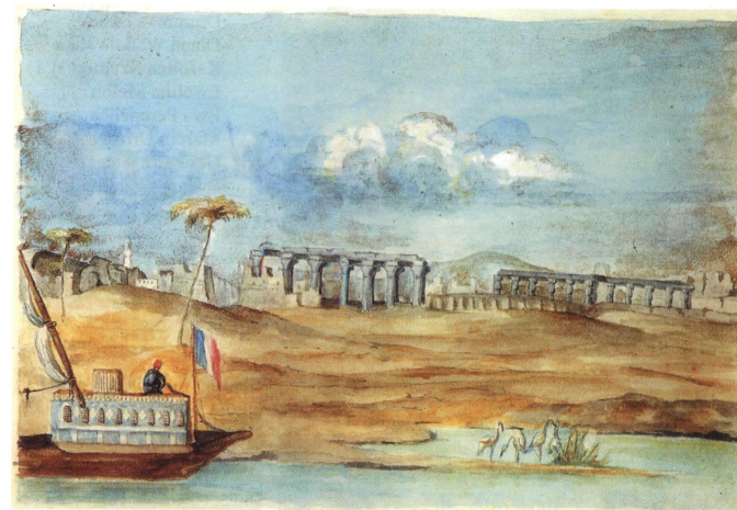
Pejzaż nad Nilem. Akwarela J. Słowackiego w Albumie podróży na Wschód