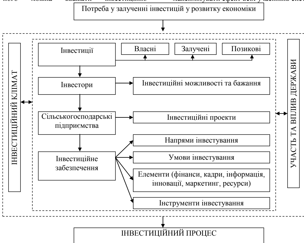
Рис. 2. Ієрархічна система гештальт інвестицій у діяльності сільськогосподарських підприємств України

На основі опрацювання теоретичних основ гештальт інвестування можна запропонувати їх наступну ієрархічну схему (рис. 2). Належне функціонування наведеної на рис. 2 системи можливе тільки на основі злагодженої участі гештальтів, які на основі виконання своїх функцій спроможні забезпечити синергетичний ефект та підвищити віддачу кожного окремого елемента у системі. Тобто, тільки на основі досягнення домовленостей між державою, інвесторами та сільськогосподарськими підприємствами можна налагодити ефективний інвестиційний процес, що передбачатиме інвестування ресурсів у найбільш прибуткові та важливі галузі аграрного сектору економіки та дозволить максимізувати ефект всіх учасників системи.