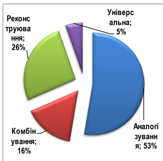
Рис. 1. Частотний розподіл використання молодшими підлітками стратегіальних тенденцій творчої діяльності.

Стратегіальну тенденцію реконструювання як перебудову основних складових стимула використали 26% досліджуваних. Використання стратегіальних тенденцій комбінування (16%) та універсальної (5%) відображає розвиток здатності молодших підлітків до трансформації заданих стимулів різними засобами, тобто здатність включати стимул як предмет активних творчих пошуків.