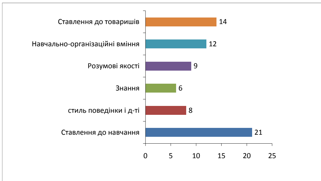
Рис.1. Прояв сфер важливих для навчання

Це говорить про те, що у процесі навчання найважливішим є здобуття знань завдяки правильному плануванню діяльності колективу, старанності кожного члена та при сприятливому психологічному кліматі.