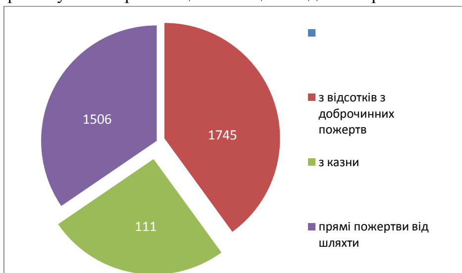
Рис. 3. Частка добродчинних пожертв у фінансуванні Волинської гімназії станом на 1807 р. (в руб.)

Як свідчать документи [10, с. 1153], щорічний доход Волинської гімназії у 1807 р. складає більш як 42 000 руб. Частка добродчинних коштів у фінансуванні Кременецького ліцею подана на рис. 3.