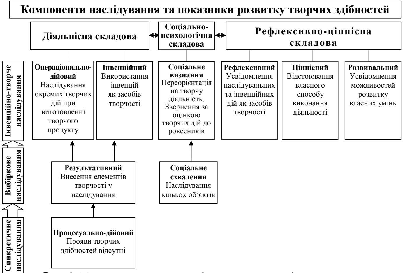
Рис. 1. Теоретична модель наслідування як механізму розвитку творчих здібностей у дошкільному віці

На інвенційно-творчому рівні наслідування діти навчаються не відкидати, а використовувати інвенції, керуються набутим раніше досвідом і внутрішніми критеріями при плануванні ходу діяльності та оцінці результатів.