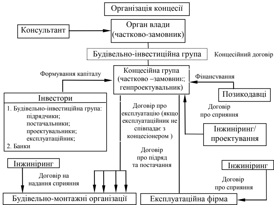
Рис. 2. Категоріальний апарат організації концесії в умовах трансформаційної економіки

Розглянуто реалії та перспективи застосування концесійної діяльності в комунальному господарстві. Необхідність залучення довгострокових інвестицій в цю галузь обумовлена наступними чинниками: потребою в залученні приватних фінансових ресурсів у житлово-комунальне господарство; встановлення зв'язку між тарифами на послуги житлово-комунальних господарств; підвищення якості та асортименту даних послуг; скасування монопольного становища держави та створення конкурентного середовища на ринку житлово-комунальних послуг.