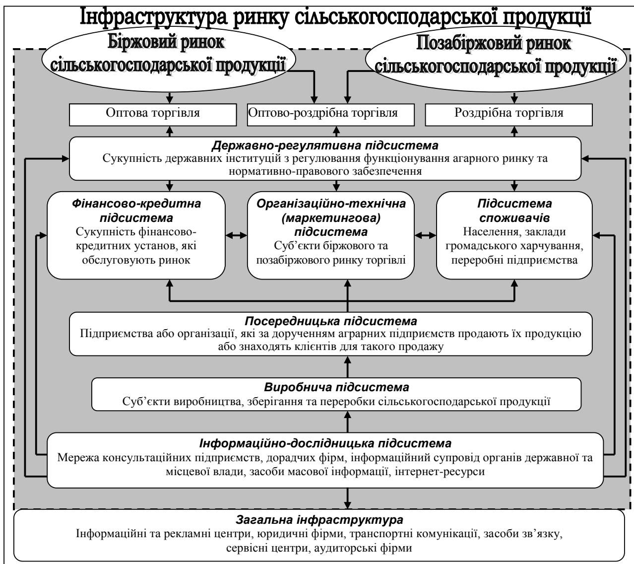
Рис. 2. Інфраструктура ринку сільськогосподарської продукції.

У другому розділі – “ Теоретико-методологічні засади статистичного вивчення ринку сільськогосподарської продукції ” – проаналізовано інформаційну місткість існуючих джерел статистичної інформації про досліджуваний ринок; здійснено систематизацію статистичних показників вивчення ринку сільськогосподарської продукції.