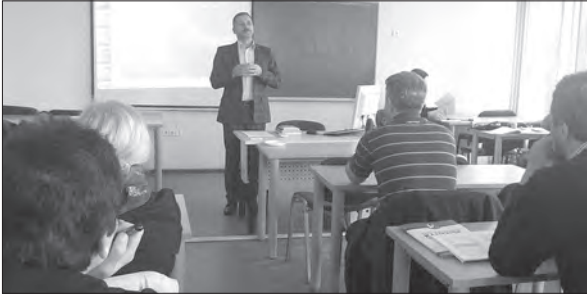
Професор Віктор Мойсієнко виголосив доповідь на V Міжнародному конгресі дослідників Білорусі в Каунасі (Литва) – жовтень 2015 р.