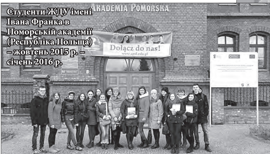
Студенти ЖДУ імені Івана Франка в Поморській академії (Республіка Польща) – жовтень 2015 р. – січень 2016 р.