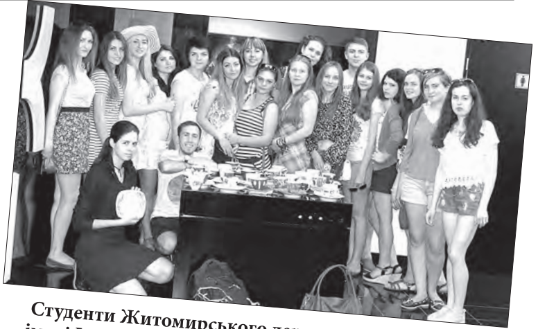
Студенти Житомирського державного університету імені Івана Франка стали учасниками міжнародного проекту «PL+UA=UE» в м. Кельце (Республіка Польща) – липень 2015 р.