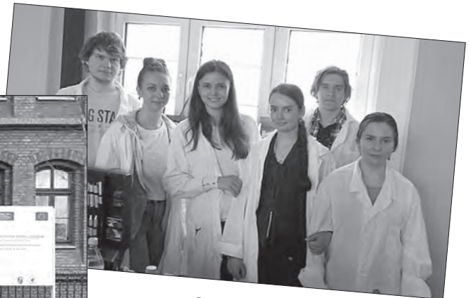
Студенти Житомирського державного університету імені Івана Франка в Поморській академії (Республіка Польща) – жовтень 2015 р. – січень 2016 р.