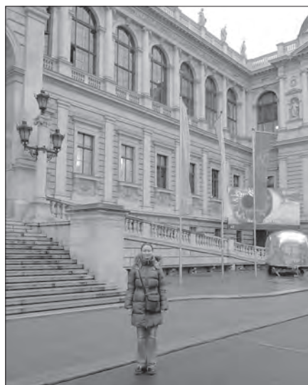
Стипендіатка Австрійського культурного форуму Євгенія Король (січень 2016 р.)