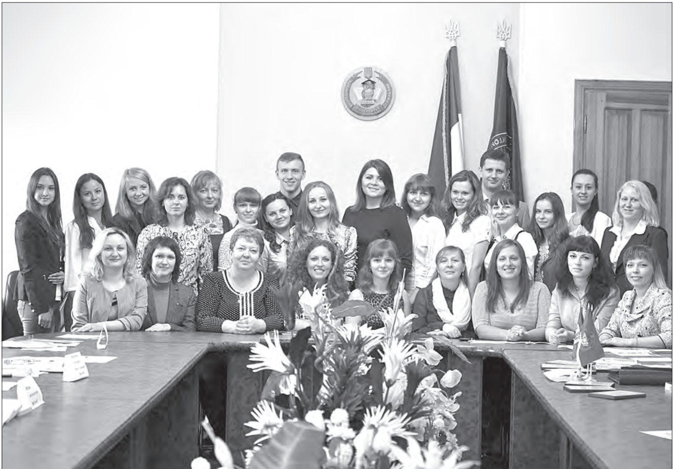
Підсумкове засідання студентського наукового товариства 28 травня 2015 року

– Студенти у всі роки однакові, лише погляди та пріоритети різні. Коли я навчалась, ми більш відповідально підходили до навчання. Сьогодні, на жаль, студенти не мають чіткої мотивації та стимулів для успішного навчання. Можливо, це проблема сьогоденного суспільства, а, можливо, вони – інше покоління. У студентів зараз вирує думка, що вища освіта в цілому не є важливою, що перевага надається все одно твоїм здібностям, талантам, а не тому, що написано у твоєму дипломі, тому багато студентів навчаються в університеті, тому що їх спонукали батьки, родичі чи стереотипи.