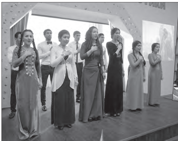
Студенти з Туркменістану виконують гімн своєї Батьківщини (жовтень 2015 р.)