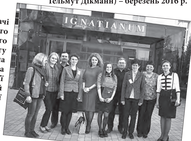
Викладачі Житомирського державного університету імені Івана Франка на конференції у Краківській академії Ігнатіанум (квітень 2016 р.)