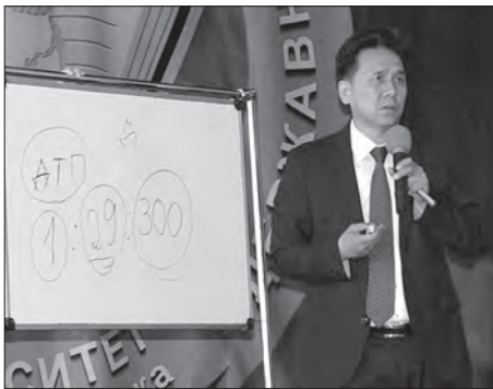
Лекція професора Міжнародного інституту розвитку інтелекту Пак Сонг Су (Республіка Корея) – квітень 2016 р.