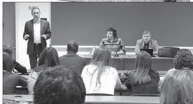
Викладачі Житомирського державного університету імені Івана Франка взяли участь у науково-практичному семінарі з інклюзивної освіти в Італії (березень 2016 р.)