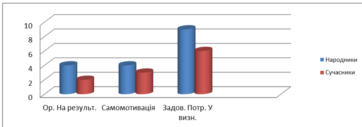
Рис.1. Змістові аспекти потреб підлітків, включених до хореографічної діяльності

Частотний аналіз отриманих результатів дозволяє здійснити порівняльний аналіз змістового наповнення потреб підлітків, включених до хореографічної діяльності (рис.1.)