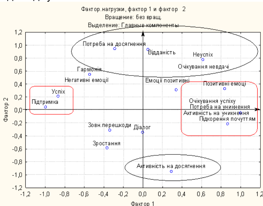
Рис.1. Факторне поле мотиваційної сфери політичних лідерів

У громадських лідерів виражені : мотив досягнення, мотив уникнення та мотив афіляції. Мотив влади слабо виражений, але він пов'язаний більше не з політичною діяльністю, а із громадською діяльністю, загалом з поведінкою та реакцією оточуючих на діяльність досліджуваних.