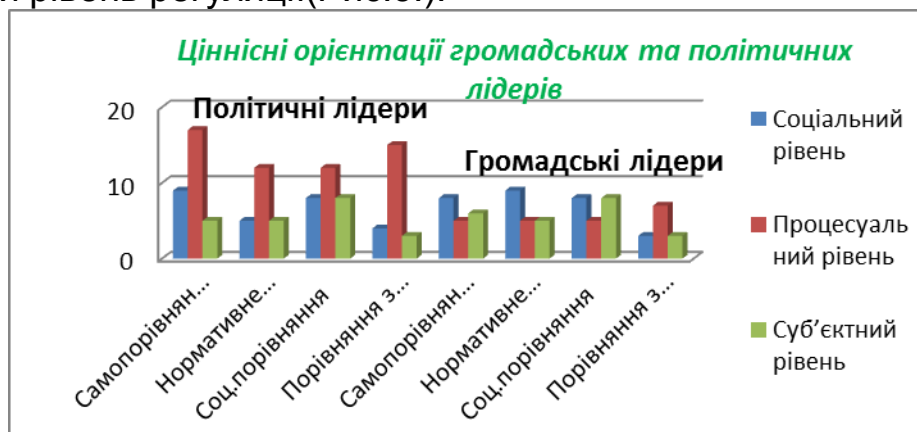
Рис.3. Ціннісна сфера громадських та політичних лідерів

Стосовно ціннісної регуляції, то в обох групах досліджуваних прослідковується рівномірний розвиток ціннісної регуляції діяльності, лише прослідковується така закономірність : у політичних лідерів переважає процесуальний рівень регуляції, а у громадських – соціальний рівень регуляції(Рис.3.).