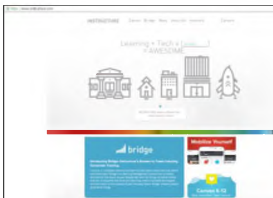
Рис 1. Головна сторінка сайту компанії Instructure.

Компанія протестувала систему на кількох місцевих школах, а також в Університеті штату Юта (Utah State University) та Університеті Бригама Янга (Brigham Young University), перш ніж офіційно запустити Canvas. До складу програмних продуктів, створених компанією Instructure, входять Canvas, Canvas Higher Ed, Canvas K-12, Canvas Network, Bridge. Розглянемо кожний програмний продукт: