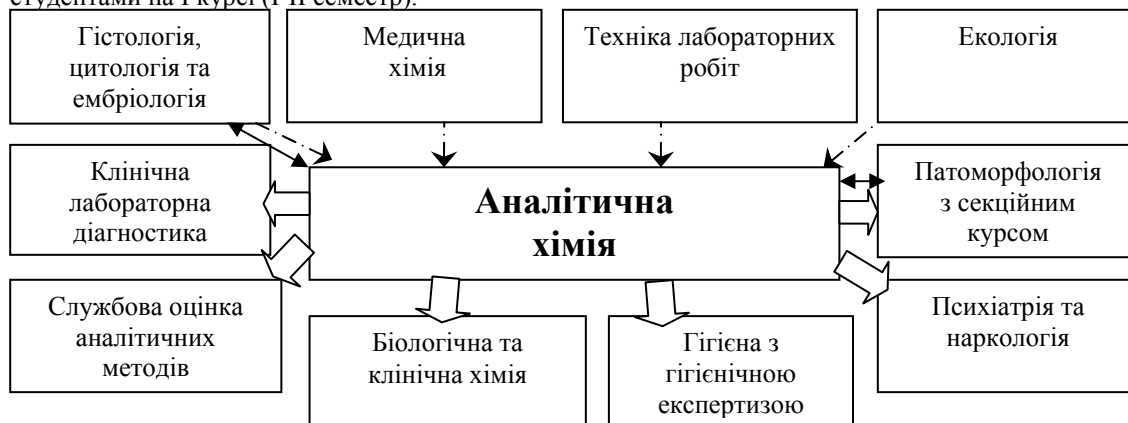
Рис. 2. Схема міждисциплінарних зв'язків аналітичної хімії з іншими дисциплінами за хронологією вивчення: попередні зв'язки: \rightarrow ; супутні зв'язки: \leftrightarrow ; перспективні зв'язки: \Rightarrow .

Як видно з рис. 1, дисципліна "Медична хімія" не має попередніх зв'язків, оскільки вивчається студентами на I курсі (I-II семестр).