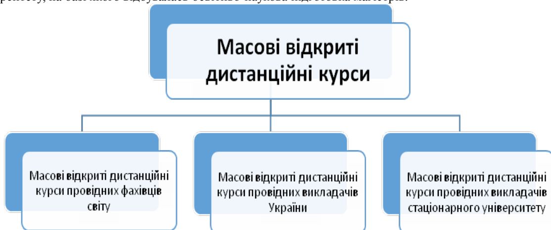
Рисунок 2. Розподіл типів масових відкритих дистанційних курсів

При підборі масових відкритих дистанційних курсів ми поділяли їх загальну кількість на три типи (рис. 2). Масові відкриті дистанційні курси провідних фахівців світу, викладачів України та викладачів університету, на базі якого відбувалась освітньо-наукова підготовка магістрів.