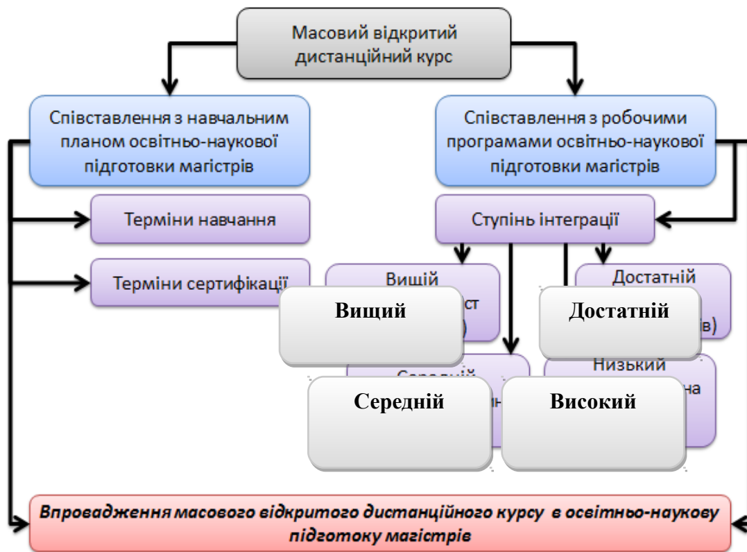
Рисунок 3. Принципова схема впровадження масового відкритого дистанційного курсу

Терміни кожного обраного масового відкритого дистанційного курсу співставлялись з відповідним семестром навчання, а терміни сертифікації з сесійними періодами. Зміст курсу співставлявся з навчальними планами та робочими програмами освітньо-наукової підготовки магістрів, визначався ступінь інтеграції [6].