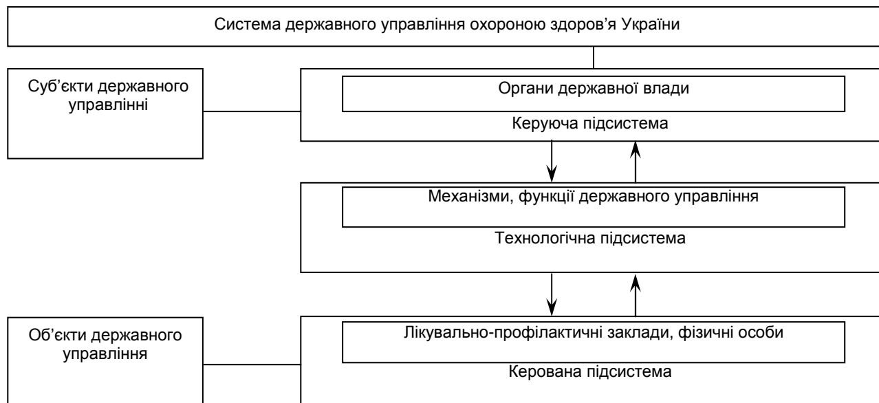
Рис. 1. Структура системи державного управління охороною здоров'я України

Ефективність системи державного управління охороною здоров'я залежить від співвідношення складності інформації керованої і керуючої підсистем (рис. 1). Сучасна організаційна структура закладів охорони здоров'я функціонує без будь-якої послідовності.