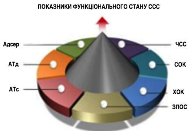
Рис. 1. Схема показників функціонального стану серцево-судинної системи

До I блоку ми віднесли показники, що характеризують стан серцево-судинної системи (ССС), II блок – показники вегетативної рівноваги, III блок – показники фізичної працездатності і енергетичного забезпечення м'язової діяльності. На нашу думку функціональний стан серцево-судинної системи представляє великий інтерес в оцінці спортивної діяльності і є більш вивченим розділом медико-біологічних досліджень у спорті [6, 14] (рис. 1).