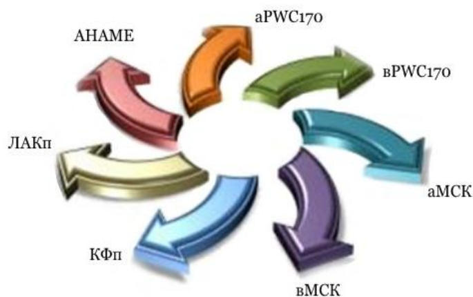
Рис. 3. Схема показників фізичної працездатності і енергетичного забезпечення м'язової діяльності

До третього блоку нами були віднесені показники фізичної працездатності і енергетичного забезпечення м'язової діяльності (рис.3). Субмаксимальний велоергометричний тест оцінює рівень загальної фізичної працездатності, допомагає отримати уявлення про рівень аеробних механізмів забезпечення фізичної діяльності (потужності і ємності, аеробної енергетичної продуктивності в цілому). Крім того тест дозволяє в повній мірі і високим ступенем об'єктивності оцінити стан гандболіста, володіє хорошими прогностичними і корекційними здібностями при оцінці спортивної діяльності протягом сезону.