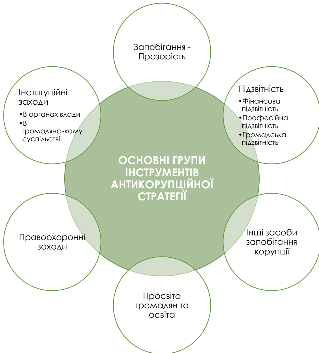
Рис.8. Основні напрямки реалізації антикорупційної стратегії