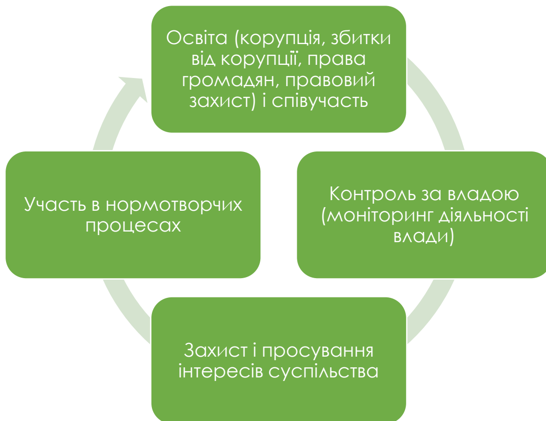
Рис.9. Головні «антикорупційні» функції громадянського суспільства

Всі ці функції взаємопов'язані, оскільки: