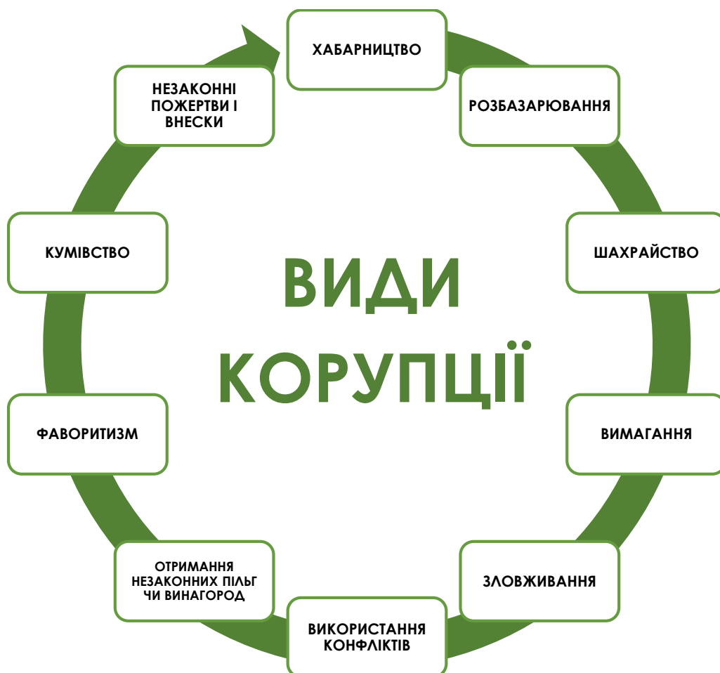
Рис. 1. Коло видів корупції в пенітенціарних установах (за результатами дослідження)