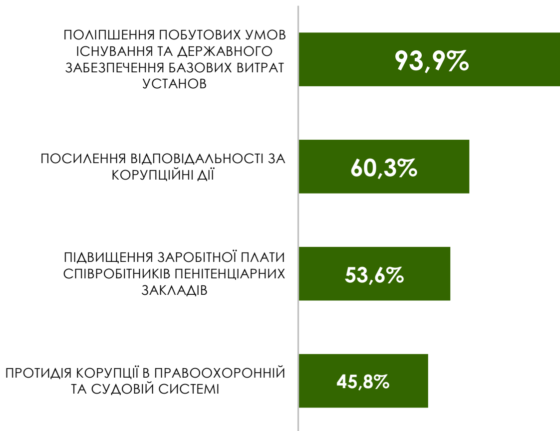
Рис.5. Пропоновані респондентами шляхи подолання корупції

Так, проаналізувавши і узагальнивши відповіді респондентів, доцільно зауважити, що вони акцентують увагу, в першу чергу, на економічних та юридичних методах, практично нівелюючи організаційні, інформаційні та соціально-психологічні методи подолання корупції (хоча й відносять явища подібного роду до основних причин виникнення корупції).