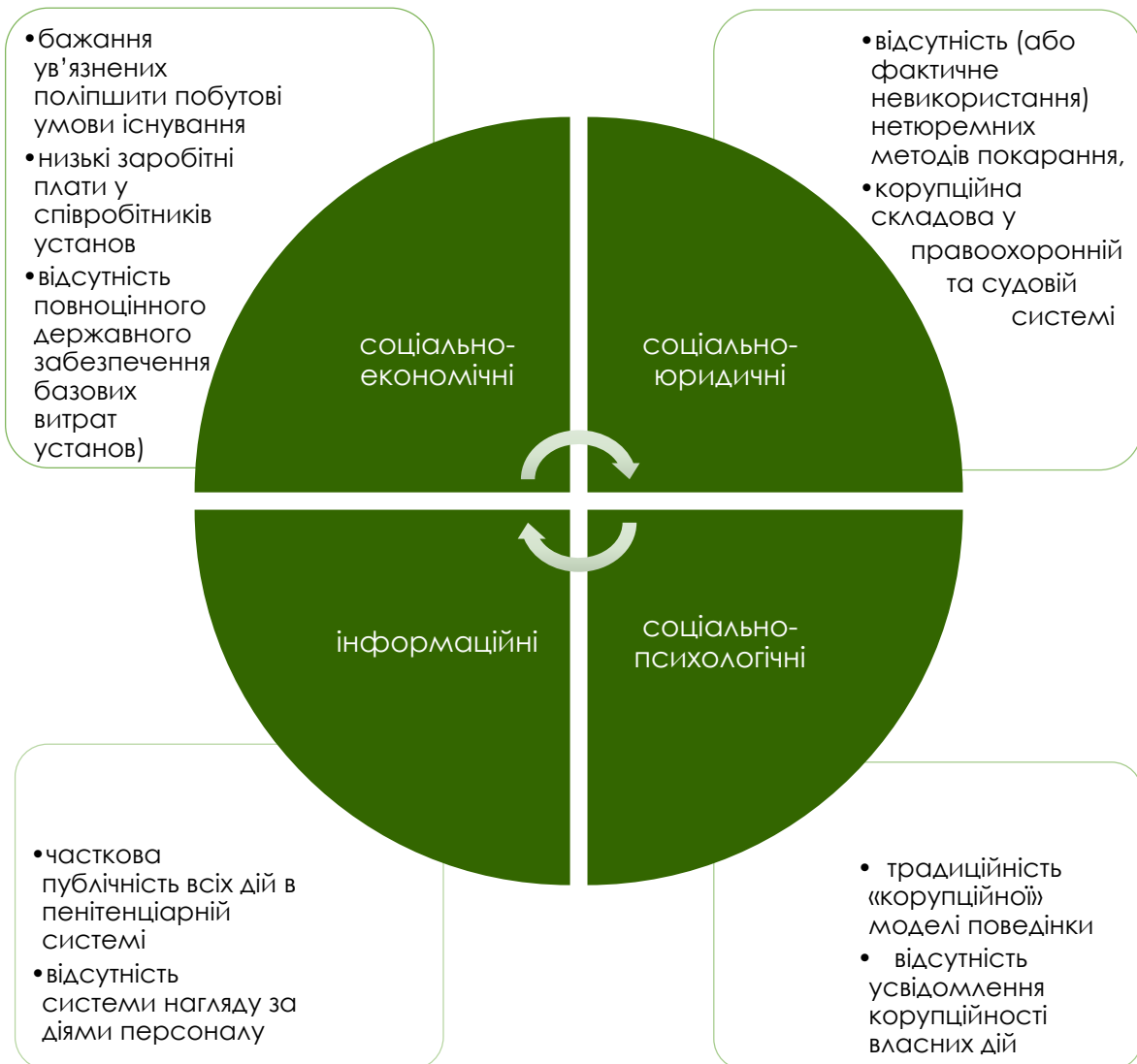
Рис. 3. Матриця причин корупції (за результатами дослідження)

В процесі проведення дослідження учасники давали свою оцінку причинам виникнення корупційних діянь в пенітенціарній системі. На основі узагальнення та аналізу відповідей учасників, можна виділити наступні ключові причини виникнення цього явища, умовно об'єднані у групи: