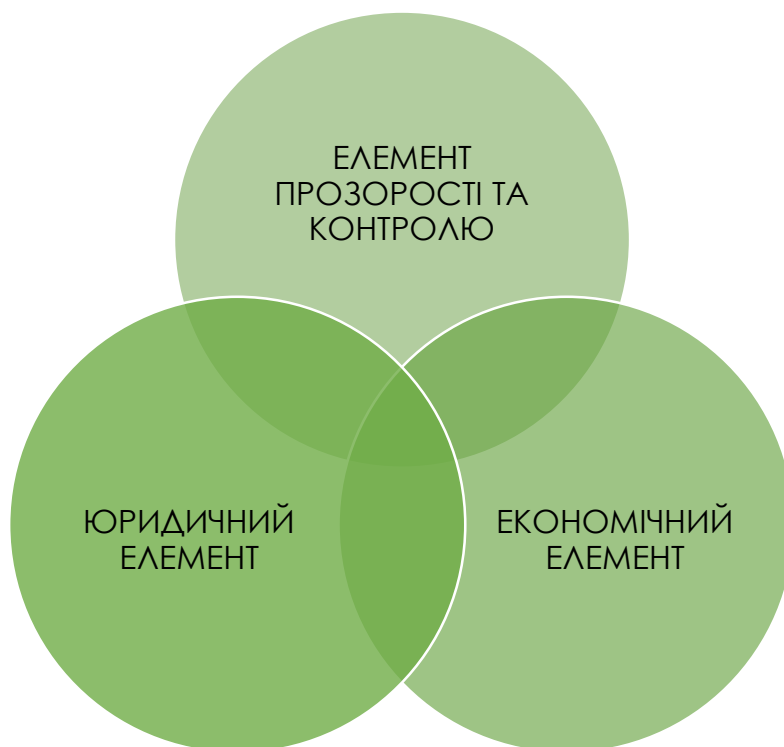
Рис.6. Базові елементи протидії корупції в пенітенціарній системі

Перш за все, доцільно було б узагальнити ключові шляхи подолання корупції на основі результатів дослідження та думки експертів. Відповідно до обробки цих відповідей, варто зазначити, що система боротьби з корупцією в пенітенціарній системі, в першу чергу, повинна включати три взаємопов'язані елементи: елемент прозорості та контролю, економічний та юридичний елементи (див. Рис.6).