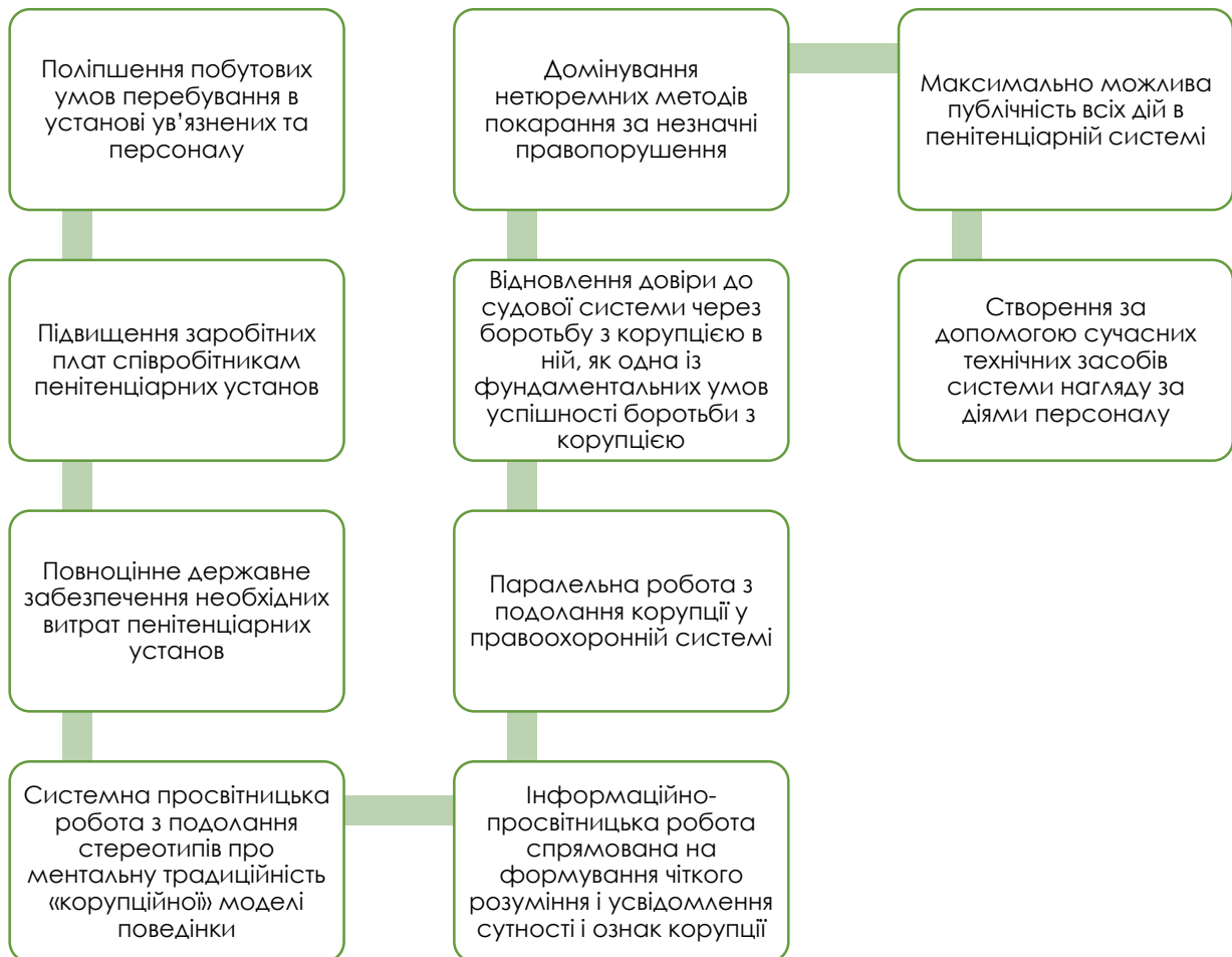
Рис.7. Кроки по протидії корупції в пенітенціарній системі