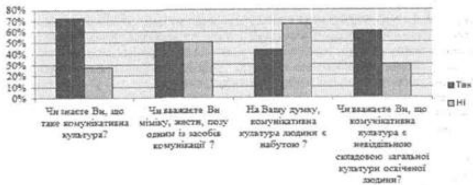
Рис.1. Визначення рівня знань про комунікативну культуру як педагогічну ланку серед майбутніх тренерів

Для того, щоб визначати сформованість комунікативної культури у студентів, ми запитали у них про комунікативну культуру як елемент педагогічної культури. Результати опитування наведені у діаграмі (рис.1).