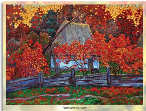
Картина Дмитра Добровольського "Червона калина"

Чи здогадалися ви, який час доби зображений на картині? Погляньте-но, як виграє сонце гранатовим полиском на верхівках дерев, як полум'яніють кущі понад тином! Так буває у надвечірніх сутінках. А чи впізнали ви зображену на полотні рослину? Хоча художник не виписав деталей, ми розуміємо: це калина — український оберіг, один із символів нашої Батьківщини.