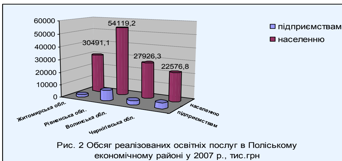
Рис. 2 Обсяг реалізованих освітніх послуг в Поліському економічному районі у 2007 р., тис.грн

Обсяги реалізованих освітніх послуг в Поліському економічному районі у 2007 році відображено на рис.2.