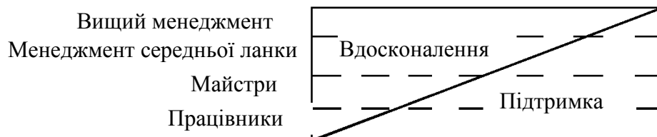
Рис. 1. Елементи системи менеджменту японських компаній

На рис.1 показано, як розподіляються в Японії функції з управління та розвитку серед різних рівнів працівників. Основними двома компонентами системи менеджменту в японських компаніях є підтримка і вдосконалення. Під підтримкою розуміються дії, покликані зберігати поточні технологічні, управлінські та організаційні стандарти; під вдосконаленням – дії, спрямовані на поліпшення діючих стандартів.