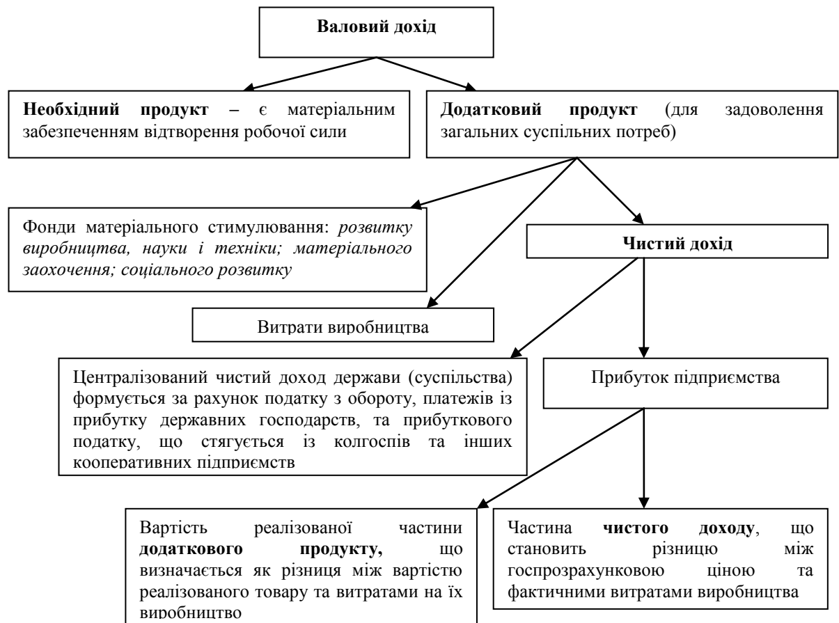
Рис. 1 Порядок розподілу прибутку в X-економіці з точки зору економічної теорії та бухгалтерського обліку

Узагальнимо вищенаведені особливості визначення і формування прибутку за часів Радянського Союзу з точки зору економічної теорії та бухгалтерського обліку на рис. 1.