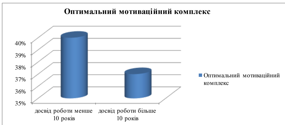
Рис. 1. Розвиток оптимального мотиваційного комплексу педагогів (за методикою «Мотивація професійної діяльності» К. Замфір у модифікації А. Реана)

Оптимальний мотиваційний комплекс сформований у 40% педагогів з досвідом педагогічної діяльності менше 10 років та у 37% педагогів з досвідом роботи більше 10 років (рис. 1).