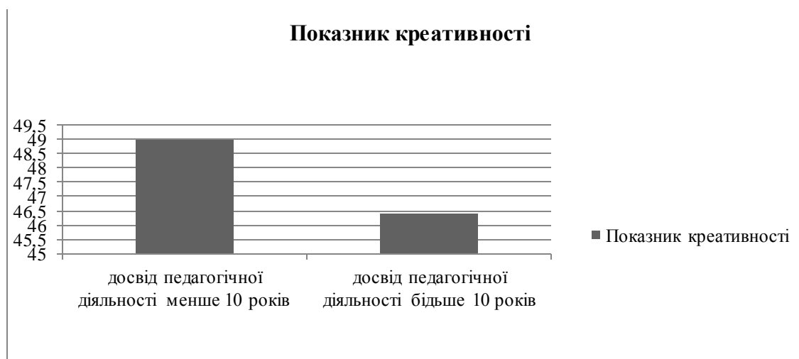
Рис. 4. Показник креативності педагогів (за методикою «Діагностика особистісної креативності» Є.Туніка)

Креативність – творчі здібності індивіда, що характеризуються здатністю до продукування принципово нових ідей. Такі здібності є незалежним фактором, елементом обдарованості.