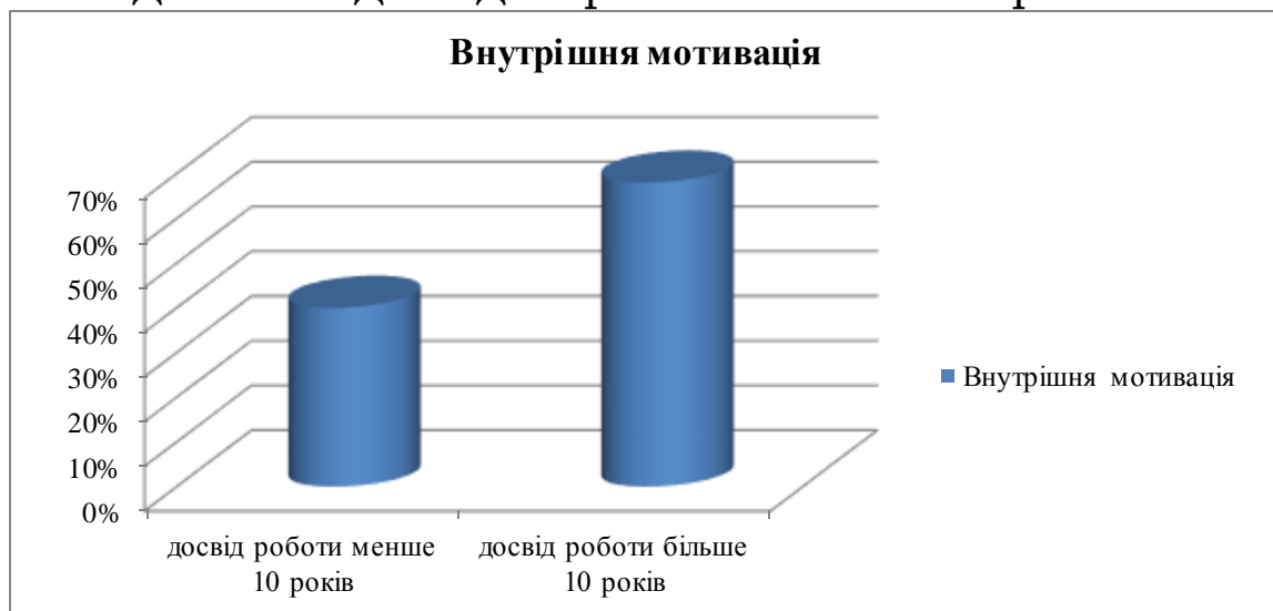
Рис. 2. Розвиток внутрішньої мотивації педагогів (за методикою «Мотивація професійної діяльності» К. Замфір у модифікації А. Реана)

Домінування внутрішньої мотивації характерне для 68% педагогів з досвідом роботи більше 10 років.