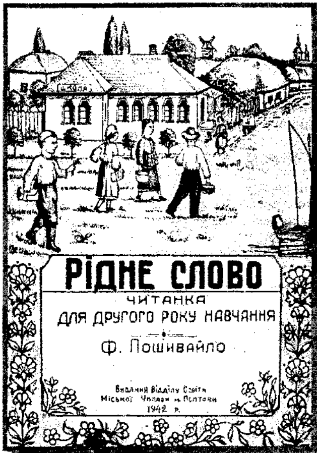
Ф. Пошивайло. «Читанка» для 2-го року навчання. Полтава, 1942 р.

У поодиноких випадках місцеві газети для допомоги вчителям та учням на своїх сторінках друкували методичні розробки з деяких навчальних предметів.