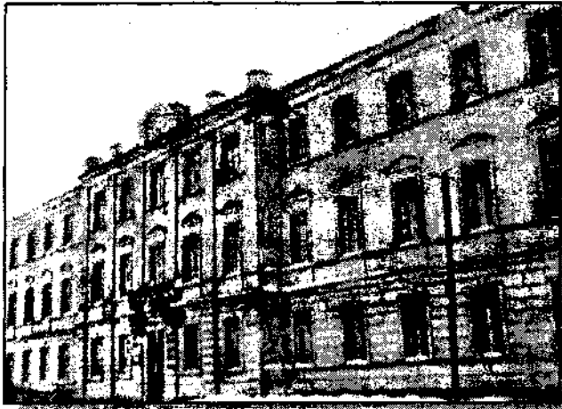
Житомирський технікум шляхового будівництва

Негативний вплив на розвиток професійної освіти мало розпорядження Коха від 24 жовтня 1942 р., яким заборонялася шкільна та професійна освіта молоді віком понад 15 років. Головним аргументом такого рішення була необхідність тотальної мобілізації молоді на роботи до Німеччини. Із різким засудженням розпорядження Коха виступило вище керівництво генерального округу «Житомир», адже рішення райхскомісара негативно впливало «на реалізацію стратегічних завдань у різних галузях цивільної адміністрації». Пізніше райхсміністр А. Розенберг у зв'язку з практичними потребами підготовки фахівців вимагав залучення частини місцевої молоді до професійної освіти.