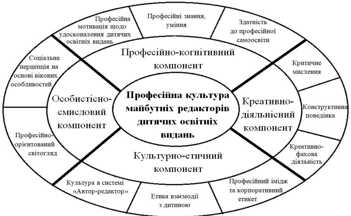
Рис. 1. Структура професійної культури майбутніх редакторів дитячих освітніх видань

Теоретично обґрунтовано модель формування професійної культури майбутніх редакторів дитячих освітніх видань у процесі фахової підготовки та визначено її блоки: цільовий (відображає соціальне замовлення, мету, завдання підготовки); змістовий (включає теоретичну та практичну підготовку студентів, яка відбувається у ході вивчення навчальних курсів і складається з ряду блоків: гуманітарного, соціально-економічного; природничо-наукового; професійного, практичного та змістового ядра – спецкурсу "Професійна культура редакторів дитячих освітніх видань"); операційний (охоплює систему форм, методів і засобів формування професійної культури майбутніх редакторів дитячих освітніх видань); результативний (включає контроль, самоконтроль, оцінку та самооцінку сформованості професійної культури майбутніх редакторів дитячих освітніх видань) (рис. 2).