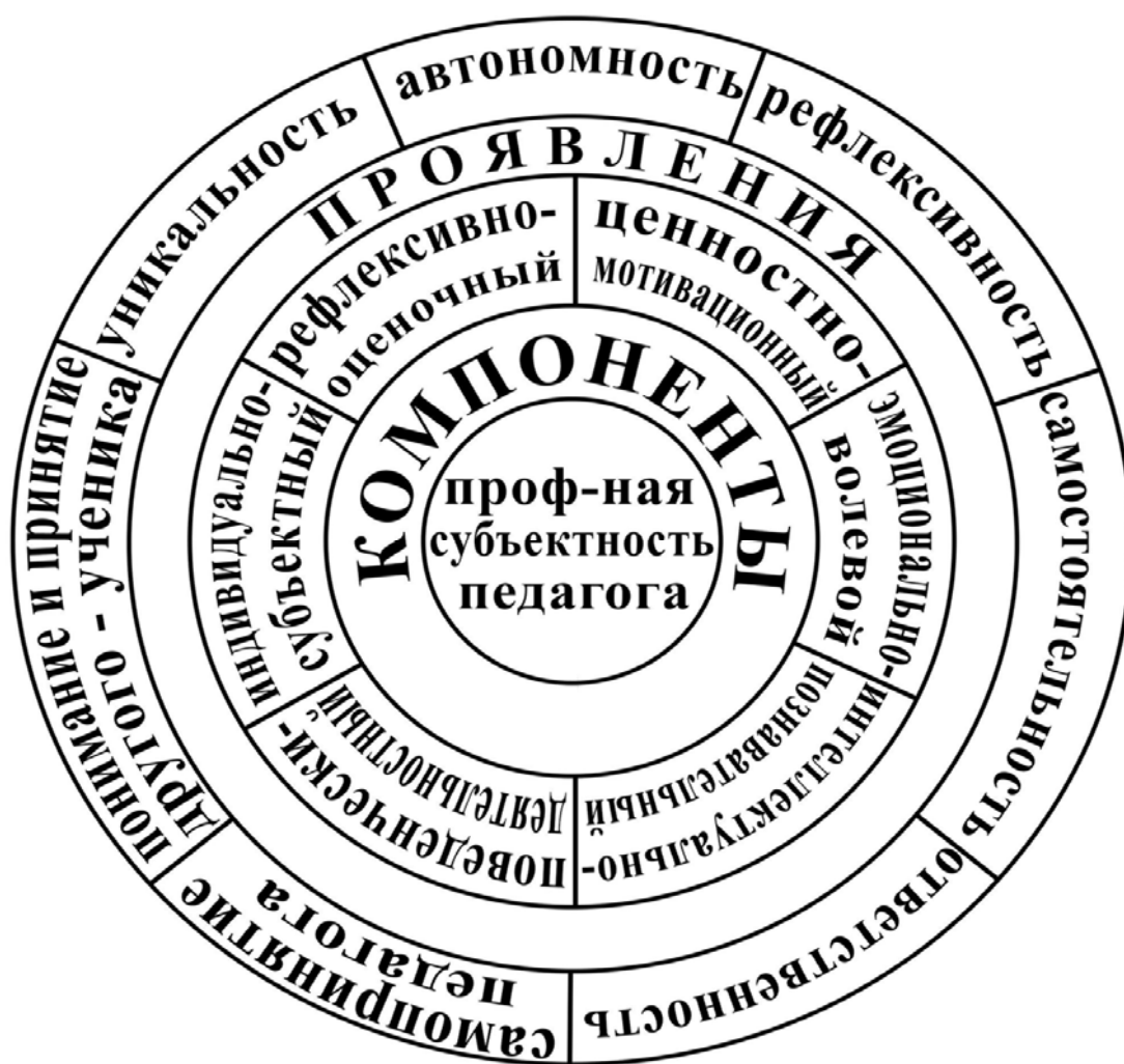
Рис. 2. Модель профессиональной субъектности учителей начальных классов

Таким образом, формирование профессиональной субъектности будущих учителей начальных классов – это целенаправленный и специально организованный педагогический процесс, основными составляющими которого являются диагностирование, проектирование, практическая реализация и мониторинг её формирования как интегрального составляющего их профессиональной подготовки в педагогическом ВУЗе. Его педагогическое моделирование позволяет составить системное представление об этом психолого-педагогическом феномене – о профессиональной субъектности (см.: рис. 2), даёт возможность увидеть новое качество в модельном представлении (см.: рис. 1), которое выводит нас на высокий уровень научных рассуждений и выводов, и обеспечивает распространение исследовательских результатов.