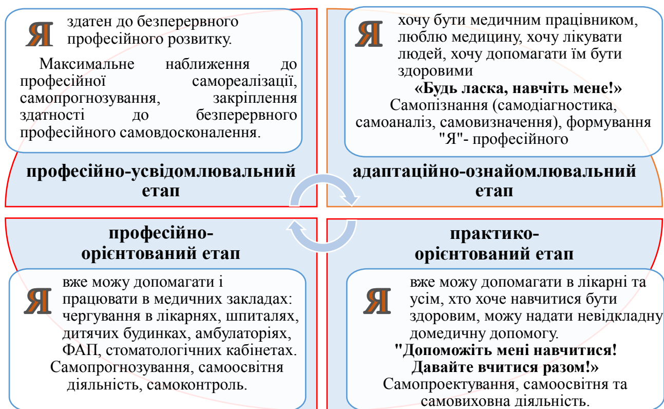
Рис. 2. Етапи методики реалізації моделі

Доведено, що кількість студентів, в яких рівень сформованості готовності до професійного самовдосконалення досягає високого та достатнього рівнів, в ЕГ вища, ніж в КГ (76 % проти 58 %), що є підтвердженням результативності експериментальної моделі та свідчить про її ефективність (див. табл. 1).