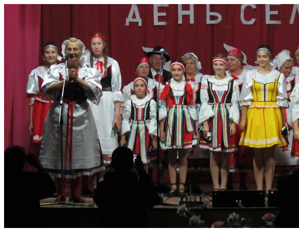
Суспільне життя Житомирського товариства волинських чехів