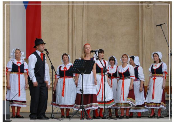
Активне громадське життя Житомирського товариства волинських чехів