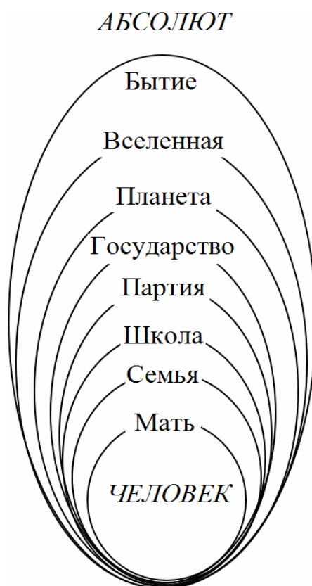
Рис. 1. Система инстанций самосознания

В последствии вместе с ростом ребенка актуализируется множество других внешних инстанций, с которыми ребенок себя идентифицирует, что обогащает ресурсы самосознания и усложняя структуру последнего. Однако человек при этом еще не достигает полного осознания себя интегральной частью Вселенной, поскольку психическая орбита существования человека пока еще не расширилась до границ Вселенной. Человек достигает этих границ постепенно, двигаясь от одной внешней инстанции к другой – от матери к первой референтной группе – своим друзьям. Потом орбита его существования начинает включать школу, страну, планету и т.д.