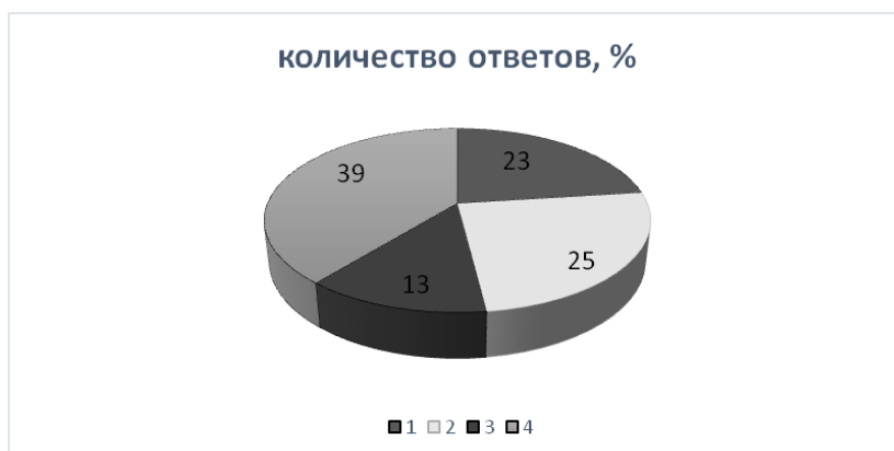
Рис. 2. Градация мотивов при выборе вида спорта студентами ХНЭУ им. С. Кузнеця в 2017 году, в %:

Результаты анкетирования выявили, что наибольшее количество студентов – 39% при выборе вида спорта, полагались на свой личный мотив. А именно участие в спортивно-массовой работе университета. Для них самым важным оказалось общение со своими сверстниками во время планирования, организации и участия в различных спортивно-массовых мероприятиях, в обмене информацией. В нашем учебном заведении проводятся комплексные соревнования – круглогодичные спартакиады среди учебных групп и сборных команд факультетов. Внутри университетские спортивные соревнования включают в себя зачетные соревнования внутри учебных групп, учебных потоков на курсе, соревнования между курсами факультетов, между факультетами. В зависимости от содержания «Положения о соревновании» состязание может быть или личным, или командным, или лично-командным. На первых этапах этой системы внутри-вузовских соревнований может участвовать каждый студент, вне зависимости от уровня его спортивной подготовленности.