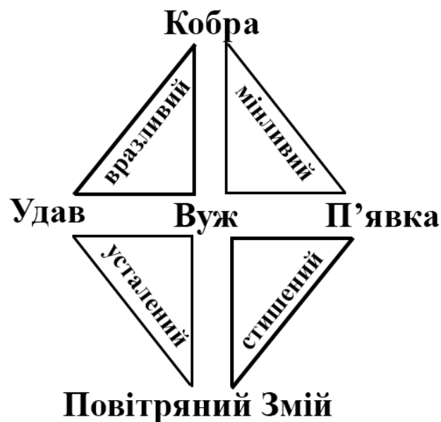
Рис. 2. Малі трикутники неврозу

Малі соціальні трикутники дозволяють прогнозувати стан суб'єкта (рис. 2). Зауважуємо, що оцінка станів у цьому випадку є приблизною. Ми не втрачаємо надії у майбутньому дати їм більш точну характеристику. Сьогодні ми схильні виокремлювати чотири основних стани невротичного суб'єкта: вразливий, мінливий, усталений, стиснений (заспокоєний) і усталений.