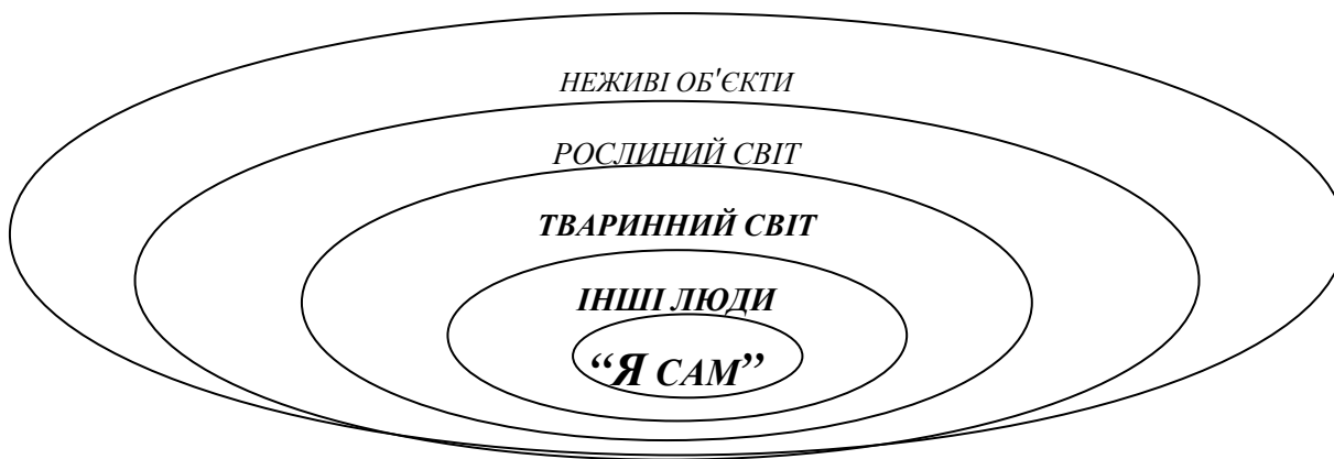
Рис. П 2. Ієрархія об'єктів Всесвіту, які можуть бути суб'єктифіковані.