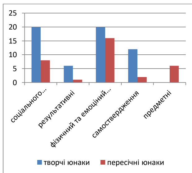
Рис.2. Структура ціннісної сфери (ретроспективний аналіз)