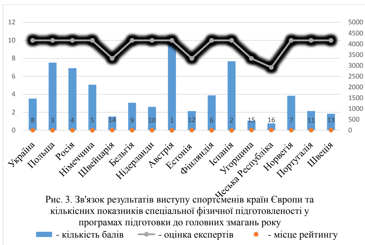
Рис. 3. Зв'язок результатів виступу спортсменів країн Європи та кількісних показників спеціальної фізичної підготовки у програмах підготовки до головних змагань року

■ - кількість балів —●— - оцінка експертів ● - місце рейтингу