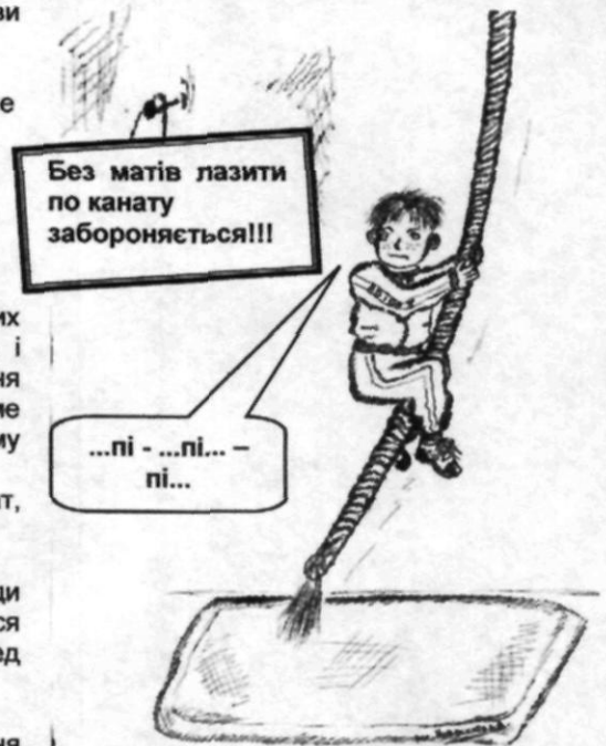
Малюнок Дарії Човожиллової

- Всі ми робимо спільну справу, яка спрямована на примноження загальнолюдського багатства – здоров'я. Я вважаю, що кожен, хто не байдужий до цієї проблеми, має зробити свій внесок, адже хто не підтримує ідею, то її руйнує.