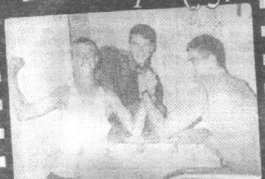
Рембо. Засушений вигляд.